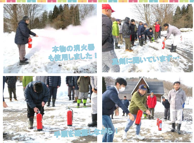
本物の消火器も使用しました！

1月15日、高義商会さんにお越し頂き、消防訓練を行いました。これまでに行った訓練では、利用者、職員のほとんどが消火器のあつかいを経験しています。今回は立候補した数名が使用手順のおさらいをしました。 「火事だ！火事だ！」と大きな声で周囲に知らせ、消火器のピンを抜き、的に噴射しながら近づいていきます。訓練の後は、グループホームや工房のどこに消火器があるか、皆で確認を行いました。いざというときに落ち着いて行動できるように、今後も訓練を続けていきたいと思えます。