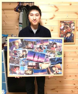
お気に入りの作品たちと…