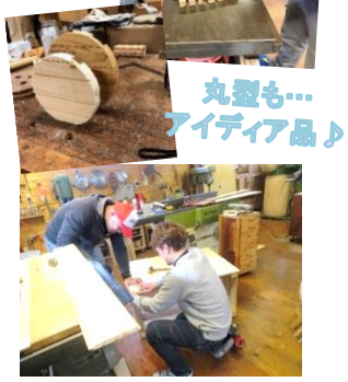
丸型も... アイデア品♪

木工房の職員2名が施設長に弟子入りし、木工小物製品作りの修行をはじめました。鍋敷き、コースター、バスルなどの製作からスタートし、ついに大型の木工品、ごみ箱が完成しました。こちらのごみ箱は現在新カメラードンで使用されています。商品にはまだまだ、修行は続きます！