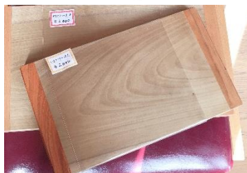
カッティングボード 2,000円～3,000円

パンなどを切つて食卓へ…便利でおしゃれな一品です。くまごろうの木工製品の中でも特に人気！写真のカッティングボードは、ヤマザクラ×ホオ等です。他にも様々な木材の組み合わせで作成できます。お気に入りを見つけてください！