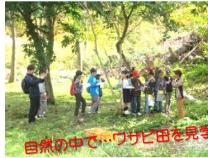
自然の中で…ワサビ田を見学

10月28日(月)、皆瀬小学校4年生の皆さんが見学に来てくださいました。当日は秋晴れの良い天気、自然いっぱいの敷地内をすべて見て頂くことができました。ハムの試食はやはり人気!「美味しい!」と言ってくれた皆さんの笑顔を見て、私たちも笑顔になりました。