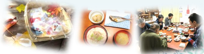
グループホームや工房(まごろう)の食事として皆で頂いています！