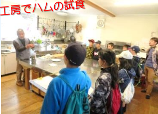
食工房でハムの試食